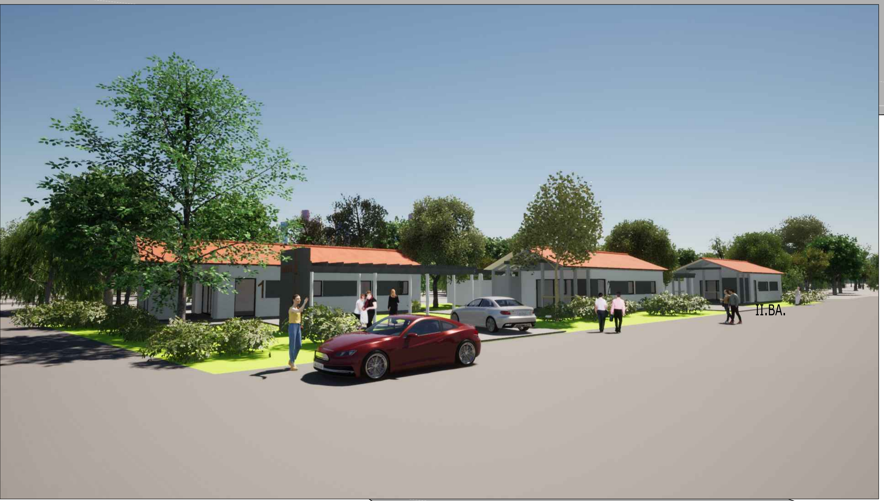
Perspektive von der Bruchstraße